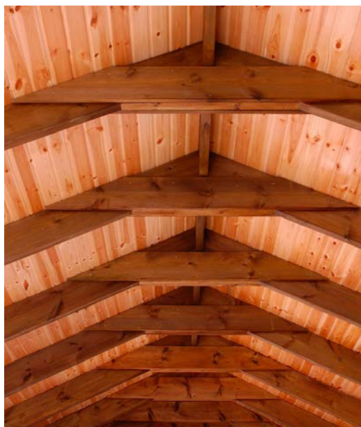
Figuur 20: Voorbeeld van een houtconstructie

De inbrandsnelheid varieert tussen de 0,5 – 1,0 mm/minuut. Na 60 minuten is naaldhout aan iedere zijde 48 mm ingebrand. Voor een kolom moet de overdimensionering van de nuttige doorsnede 4 \times 48 \text{ mm} = 192 \text{ mm} zijn.