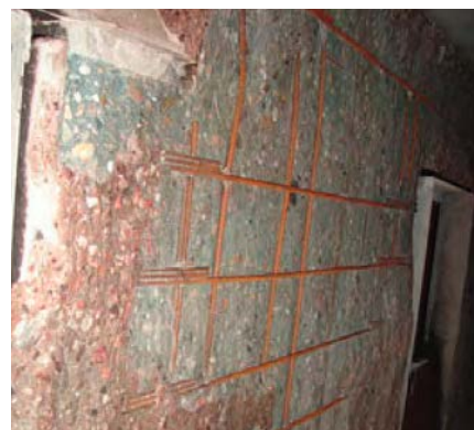
Figuur 22: praktijkvoorbeeld van beton dat van de wapening is afgespat