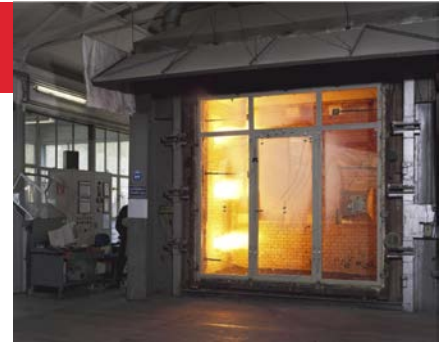
Figuur 30: Start brandproef van een enkele deur met twee zijlichten en een bovenlicht.

Er dient gelet te worden op de montage van het kozijn in de wand, bij inmetSELkozijnen dient het kozijn conform rapport veelal vol gemorteld te worden en bij montage kozijnen moet de constructie geplaatst worden conform rapport. Bij montage van de deur in het kozijn moet vooral gelet worden op de hang- en sluitnaad en de ruimte boven en onder de deur. De hang- en sluitnaad en de ruimte boven de deur zijn veelal beperkt tot 3 mm en de ruimte onder de deur tot 6 mm. De ruimte onder de deur kan groter worden indien er gewerkt wordt met een gecertificeerde valdorpel oplossing.