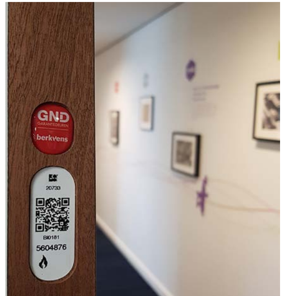
Figuur 34: Voorbeeld van een GND label

Het label is geen classificatierapport, maar helpt u bij beoordeling of een geclassificeerde oplossing juist verwerkt is of tenminste wie het juist had moeten verwerken.