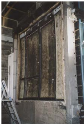
Figuur 31: Brandproef van een schuifpui 3,2 m hoogte met brandwerend glas (het brandwerende glas is reeds opgeschuimd).

Nabewerkingen zoals bijvoorbeeld het maken van glasopeningen, ventilatieopeningen, aanbrengen van een deurstop en dergelijke zijn niet toegestaan.