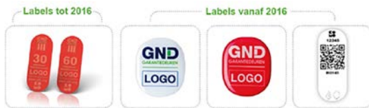
Figuur 33: Voorbeeld van evolutie in labels