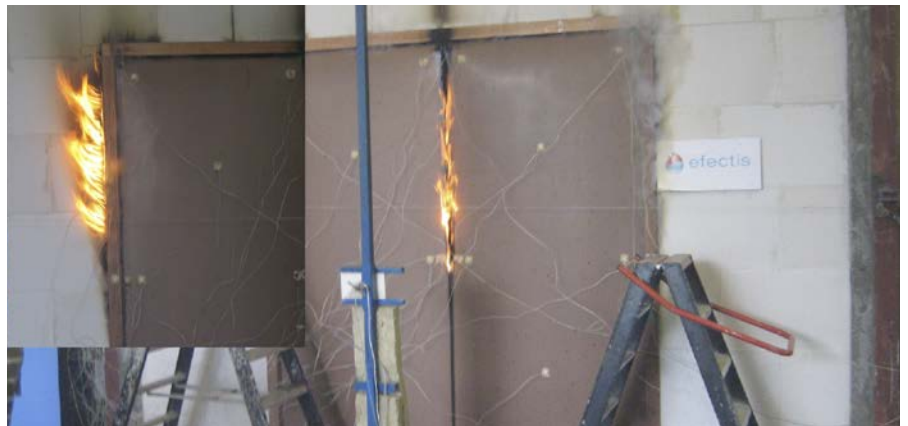
Figuur 32: Einde brandproef van een houten dubbele deur na 37 minuten.