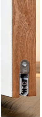
Figuur 29: Foto van een valdorpel

profielstalen- en aluminium deuren geldt dat de opbouw en het aantal kamers van de toegepaste profielen hetzelfde dient te zijn als getest. Welke toepassing noodzakelijk is (binnen- / buitendraaiend, brand- en/of rookwerend, zelfsluitend etc.) volgt uit de brand- en/of rookwerendheidssymbolen zoals op de plattegronden zijn weergegeven (zie hoofdstuk 1.1).