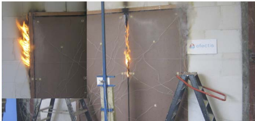
Brandproef van een schuifpui 3,2 m hoogte met brandwerend glas (het brandwerende glas is reeds opgeschuimd).