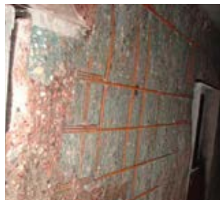
Figuur 3: praktijkvoorbeeld van beton dat van de wapening is afgespat